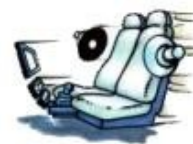
ISO KONEKTOR REPRODUKTOROVÝ